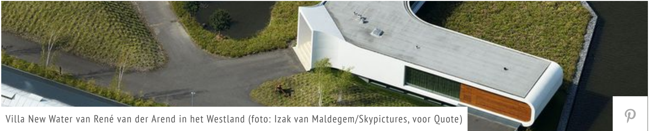
Villa New Water van René van der Arend in het Westland

Eigenlijk waren we met onze Qheli op weg naar het Noorden, toen we plots dit supermodernistische juweeltje onder ons zagen liggen. Even een extra rondje dus.