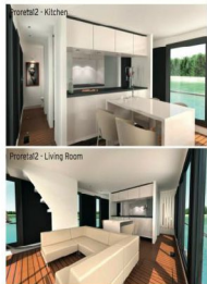
Proreta2 - Kitcher