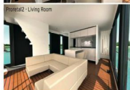
Proreta2 - Living Room