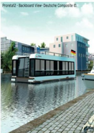
Proreta2 - Backboard View - Deutsche Composite ©.