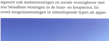
Het 'drijvende' appartementencomplex de Citadel in het midden van de voormalige Poelpolder

menten voor jong en oud. Het project is ingedeeld in acht zogenaamde waterkamers: gevarieerde woongebieden die onderling van elkaar verschillen voor wat betreft waterberging en bebouwingskarakteristieken.