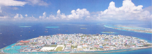
De overvolle hoofdstad Malé