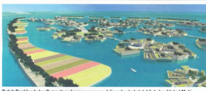
Dutch Docklands heeft grote plannen voor een drijvende stad vlak bij de hoofdstad Malé

De Maledivische minister voor Privatisering zei in april, toen de eerste overeenkomsten met Dutch Docklands werden getekend, tegen het Britse dagblad The Sunday Times : 'Als de eerste projecten goed verlopen, gaan we ook met hen samenwerken om drijvende woongebieden te ontwikkelen.' Tot nu toe gaat de overeenkomst dus nog uitstekend over toeristische projecten, maar Dutch Docklands is hoopvol dat het nog veel meer gaat laten drijven op de Malediven. 'Wat dacht je van drijvende rijstvelden, zonnepanelen of een hele stad? De definitieve beslissing over dat soort projecten is nog niet genomen, maar in februari presenteert president Nasheed zijn visie op de toekomst van het