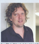
Koen Olthuis: 'Drijvende steden zinken niet'

keren aandacht van grote internationale media zoals het Amerikaanse dagblad The New York Times en tv-zender Discovery Channel, en hij stond in 2007 in een top-200 van invloedrijkste mensen ter wereld van het Amerikaanse magazine Time .