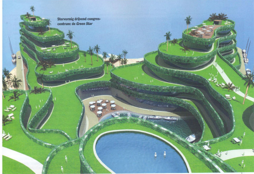
Sternvormig drijvend congrescentrum: de Green Star