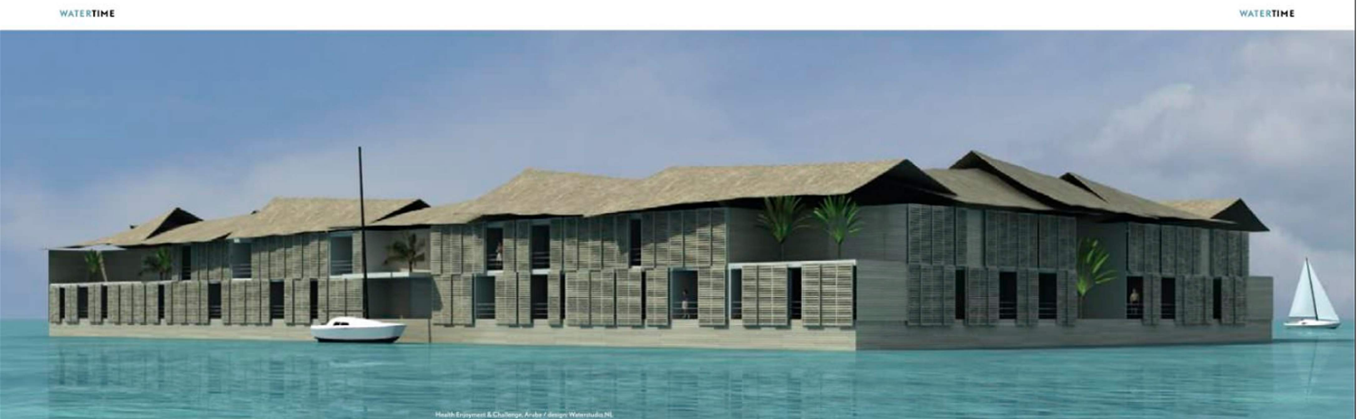
Health Equipment & Challenge, Aruba / design Waterstudio.NL