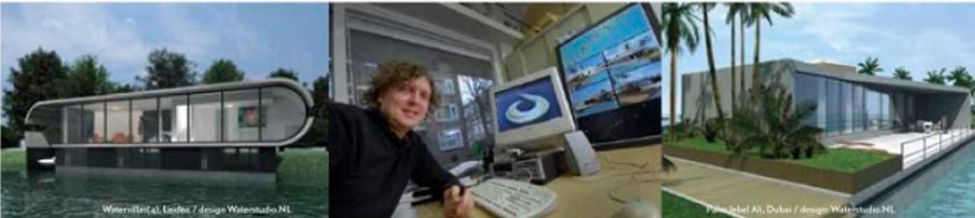
Watervilla's, Leiden / design Waterstudio.NL

verder. "Ik zou graag de Randstad uitbreiden over het water. Een drijvende wijk, school of snelweg kun je gemakkelijk verplaatsen. Dat maakt de stad dynamisch. Als een Vinex-wijk vergrijst, vaar je de school met een duwboot naar een andere locatie." Dat is minder utopisch dan het klinkt. Drijvende snelwegen liggen al in de Perzische Golf bij Dubai (Verenigde Arabische Emiraten). Hier werkt het Rijswijkse bedrijf samen met Dutch Docklands en Royal Haskoning momenteel ook aan enkele drijvende eilanden als onderdeel van het megaproject van de sjeik. Palm Jebel Ali. Van bovenaf gezien vormen de eilanden afzonderlijke Arabische