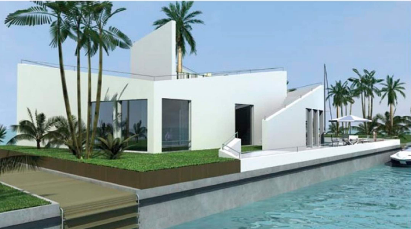
Palm Jebel Ali, Dubai / design Waterstudio.NL

"There's a garage, a drive, a garden: exactly the same facilities as homes on dry land"