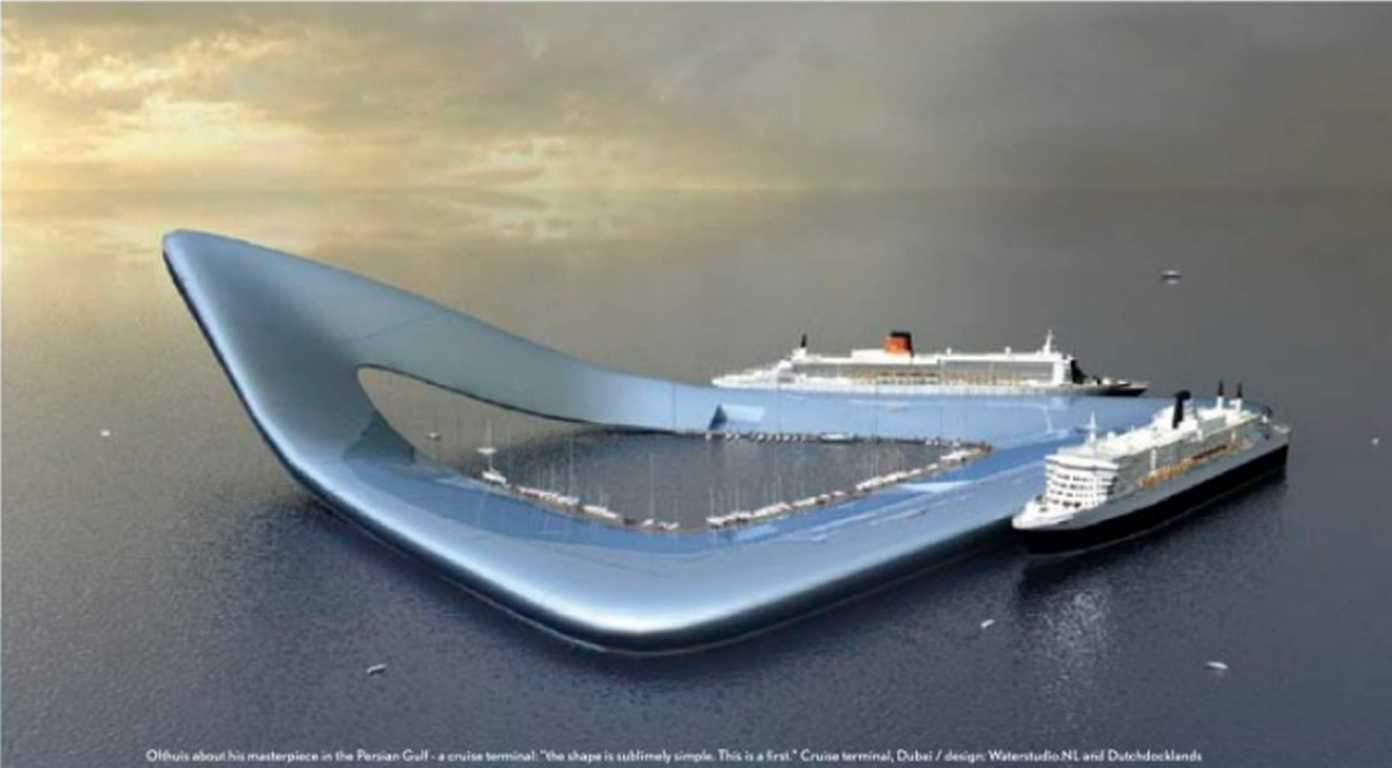
Olthuis about his masterpiece in the Persian Gulf – a cruise terminal. "The shape is ultimately simple. This is a first." Cruise terminal, Dubai / design Waterstudio.NL and Dutchdocklands

Het moderne wonen op het water is volgens Waterstudio.NL vooral geen gammelle woonark ergens in een oer-Hollandse sloot met eendenkroos. In hun waterwoningen merk je juist niet dat je op het water zit. Een tuin, garage, oprijlaan: alles is mogelijk op het water, net zoals op het vasteland. Olthuis: "We bouwen zo dat het bij elke windkracht voelt alsof je vaste grond onder je voeten hebt. En je boodschappen over een loopplank sjouwen is niet nodig, want de auto parkeert je naast je woning." Zijn ambities reiken